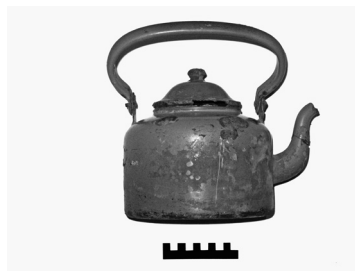
Afb. 3 - Waterketel (kleur terracotta, schaal 10 cm)

P.A. Seinen, J.A. van den Besselaar, Een houten vissersschip in de Maas bij Alem, een echo uit het verleden, Westerheem, 2012, pag. 310-321.