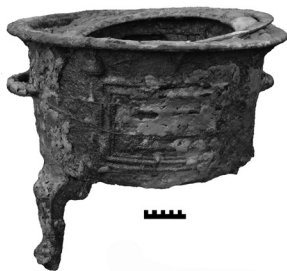
Afb. 2 - Komfoortje of 'peurtje' of 'vuurduvel' (schaal 10 cm).