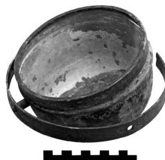
Afb. 6 - Kompas met cardanische ophanging (schaal 10 cm)