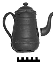
Afb. 4 - Koffiepot (kleur petrol-blue, schaal 10 cm)